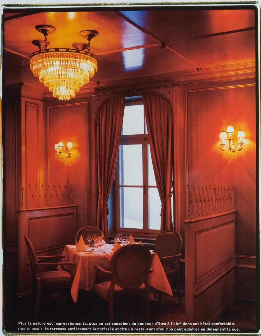
Plus la nature est impressionnante, plus on est conscient du bonheur d'être à l'abri dans cet hôtel confortable. PAGE DE DROITE, la terrasse entièrement lambrissée abrite un restaurant d'où l'on peut admirer en déjeunant la vue.